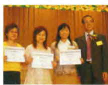
第六屆九龍城區學校 優秀家長嘉許禮