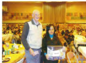
春節聯歡晚宴 (10週年聚餐)