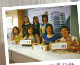
關愛學童·苗圃行動