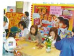
陳瑞祺(喇沙)小學 35週年校慶開放日