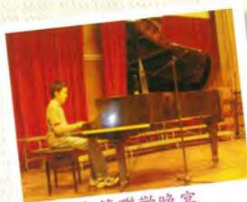
春節聯歡晚宴 (10週年聚餐)