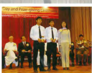
Outstanding Sportman & ECA Awards 07'