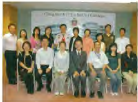
第十屆執行委員會