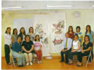
老師和我們齊來畫書畫