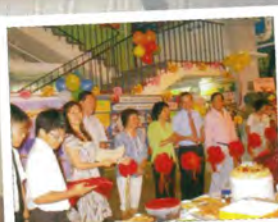
家長資源中心開幕