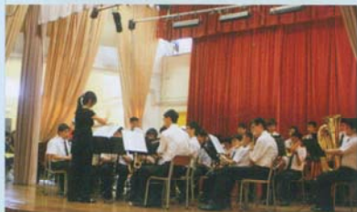
大會中的才藝表演