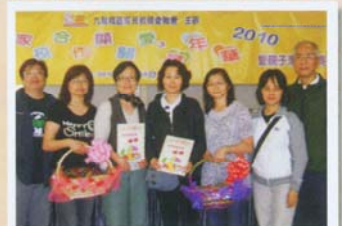
本會獲得烹飪比賽雙亞軍