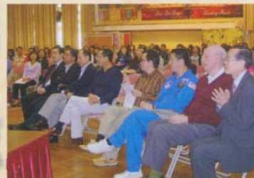
「教學語言微調」座談會 喇沙會修士到訪晚會