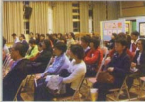
家長工作坊 「壓力指數」講座