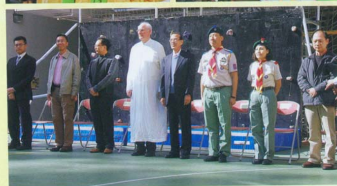
四十週年校慶晚宴