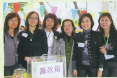
四十週年校慶 - 「繽紛四十嘉年華」