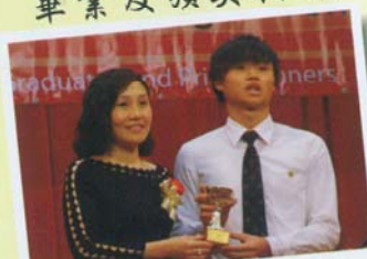
頒發課外活動和運動員傑出成就獎