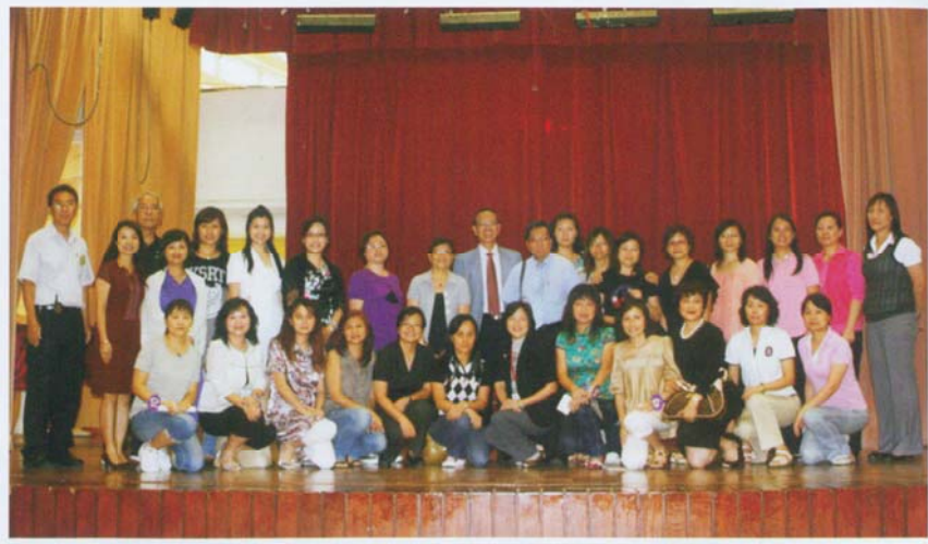
第十二屆會員大會義工嘉許大合照

校長、老師、舊生、家長和學生在大會中聚首一堂，欣賞精彩的才藝表演後，家長聽取會務和財務報告，選出新一屆執行委員；大家一邊等候點算投票結果，一邊享用茶點，期間開心地與老師聚一聚，了解一下孩子在校的情況。