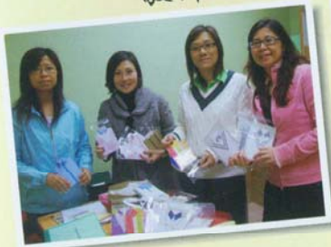
敬師及心意卡製作活動