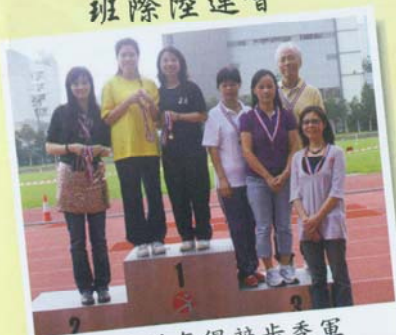
家長隊奪得競步季軍