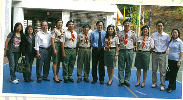
九龍第205童軍旅旅慶