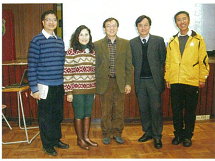
「自願優化班級結構」政策座談會