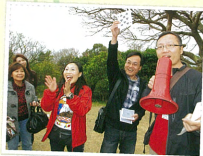
春日聯歡親子遊 (與舊生會合辦)