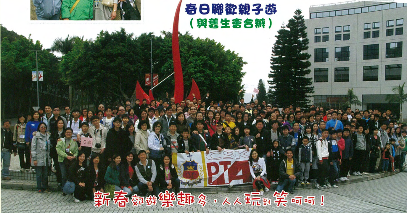
新春郊遊樂趣多，人人玩到笑呵呵！