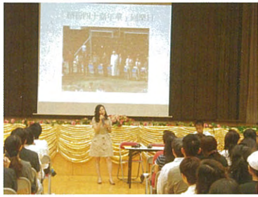
陳瑞祺小學小一迎新日