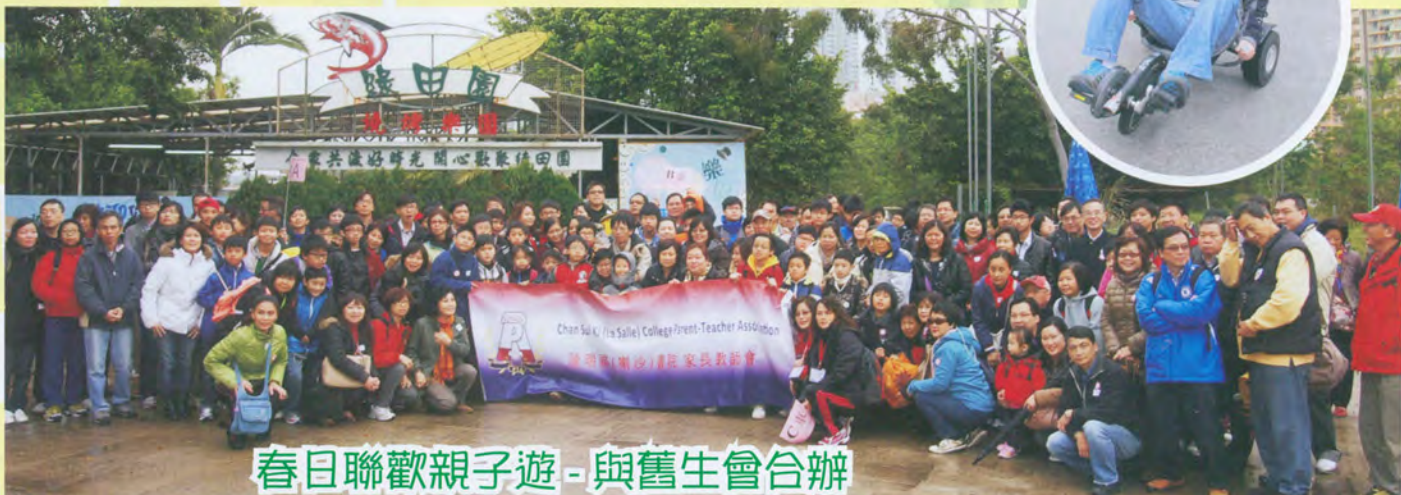
春日聯歡親子遊 - 與舊生會合辦