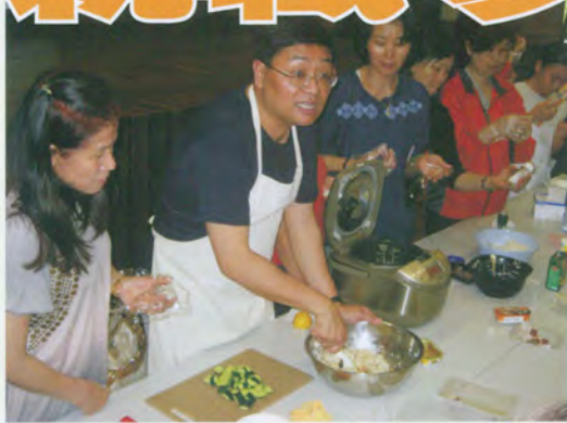
家長工作坊 孩子努力學習，父母同樣不斷增值！