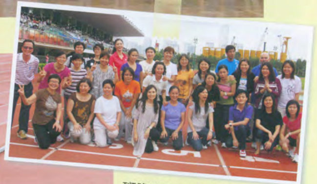
班際陸運會競步友誼賽 友誼第一，比賽第二