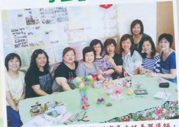
逢星期一上午，技藝純熟的家長出任義務導師，教導各種手工藝製作