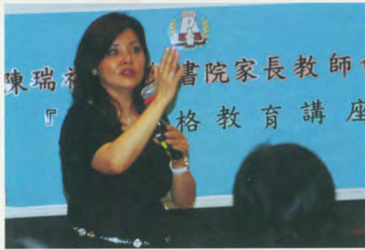
家長講座 專業的導向和講解，令我們幫助孩子達到更全面的發展！