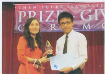
優秀運動員獎及ECA獎牌