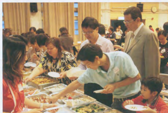
家長茶聚 了解學校的發展及子弟在校學習的情況，與班主任進行輕鬆的茶聚再好不過！