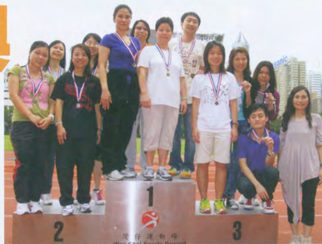
班際陸運會競步友誼賽