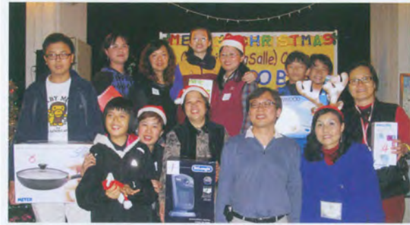
聖誕聯歡燒烤晚會.....普天同慶！ 家長、老師、學生、舊生，濟濟一堂，樂也融融！

敬師及心意咭製作活動 我們以美味的湯水、甜入心的糖水、新鮮的生果及心意咭來表達我們對老師的謝意！