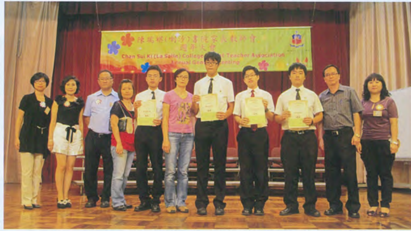
一分耕耘，一分收穫，同學努力向前邁進，共勉之！