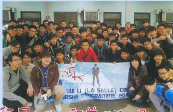
師兄教導，師弟理想更易達到！