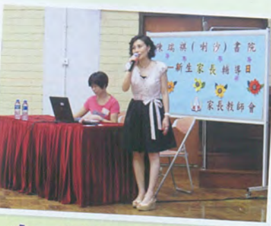
中一新生家長輔導日