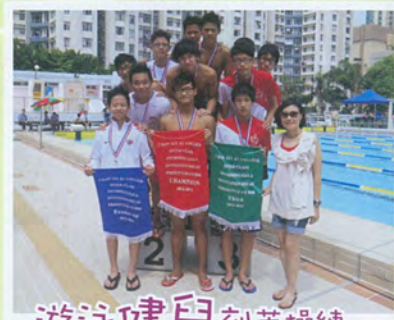
游泳健兒刻苦操練， 宗長支持靜候佳績