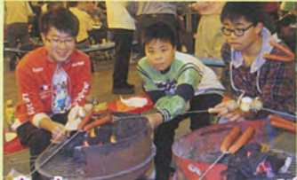
除了燒烤食品，還有好味糖水、抽獎，最重要是氣氛熱鬧愉悅！