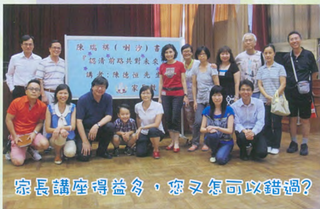
家長講座得益多，您又怎可以錯過？