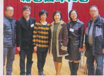
嘉年華會樂繽紛， 宗校合作意義深