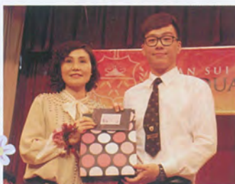
一片青天展前程， 美好將來更光明