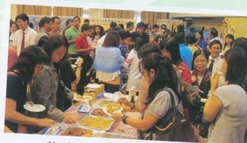
歡聚一堂 品嚐美食