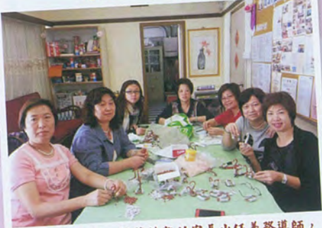
逢星期一上午，技藝純熟的家長出任義務導師，教導各種手工藝製作