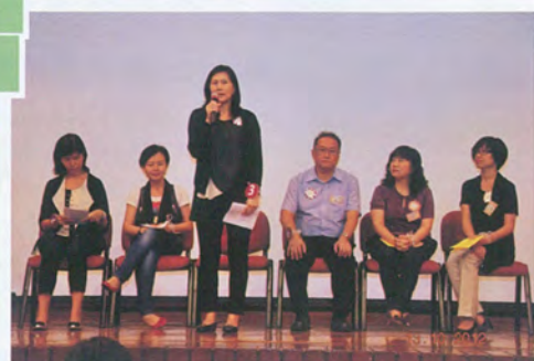
積極參與 踴躍投票