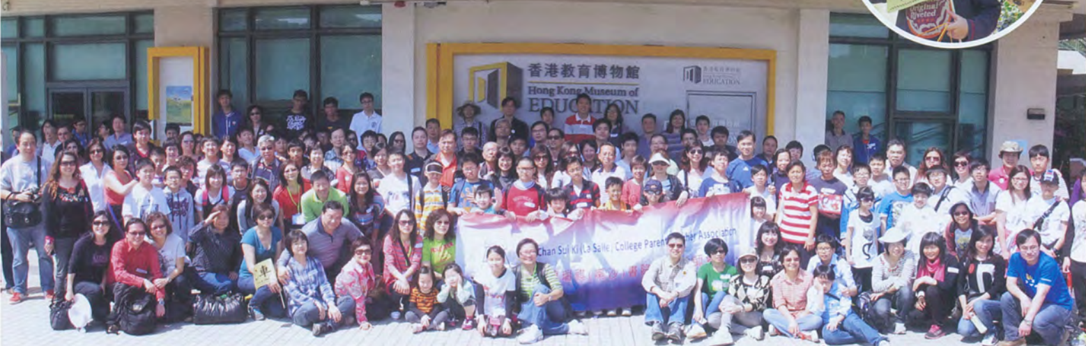
春雨綿綿正好眠？我就話：「春天旅行不需眠，身體健康醫師免！」