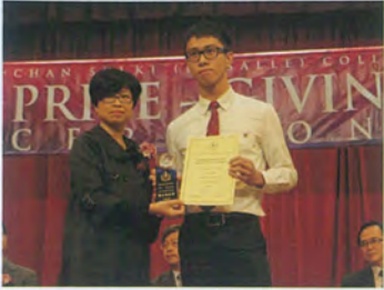
運動員傑出成就獎及ECA獎