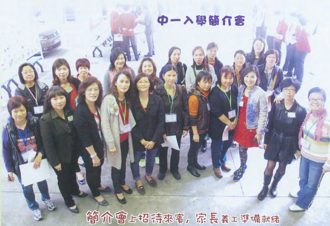
簡介會上招待來賓，宗長義工準備就緒