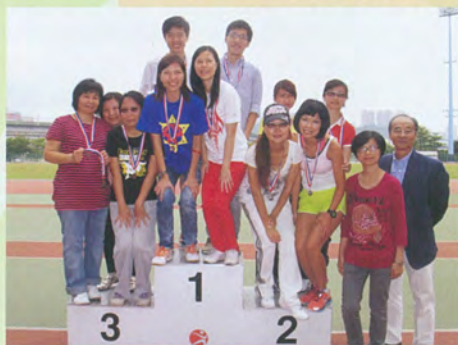
班際陸運會競步友誼賽