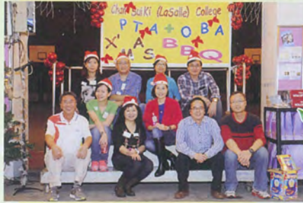
學生製作心意咭，家長菜餚了不得，齊奉老師多深刻