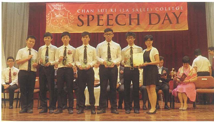
運動員傑出成就獎及ECA獎

家長教師會將大部份支出投放於贊助學生活動。除了贊助學生的學業及運動的獎項外，也贊助領袖訓練營、學生的升學及就業活動，還有學生會綜藝晚會等。由2011年開始，家教會更與學校及舊生會合辦朋輩升學輔導計劃，由職場上或升學了的師兄協助學弟認清前途、踏上青雲路。