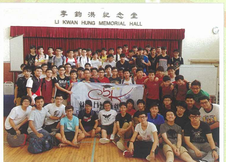
朋輩升學輔導計劃