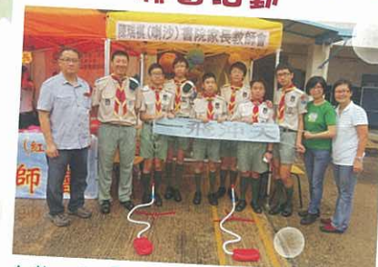
九龍城區「家校合作顯關愛」嘉年華