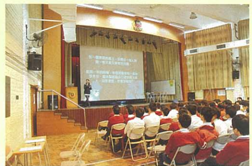
職業導向 - 中六模擬放榜