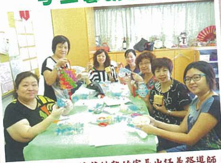
逢星期一上午，技藝純熟的家長出任義務導師，教導各種手工藝製作