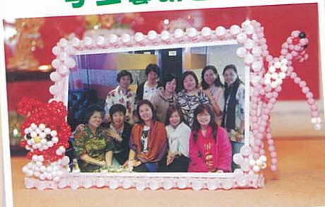
逢星期四上午，技藝純熟的家長出任義務導師，教授各種手工藝製作