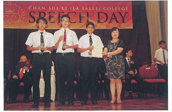
運動員傑出成就獎及課外活動傑出成就獎