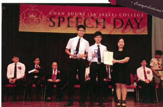
運動員傑出成就獎及課外活動傑出成就獎