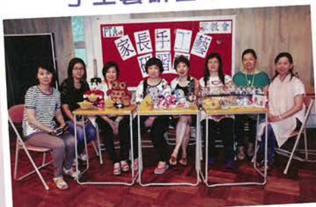
逢星期一上午，技藝純熟的家長出任義務導師，教授各種手工藝製作