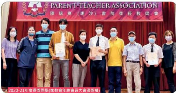
2020-21年度得獎同學(家教會年終會員大會頒獎禮)