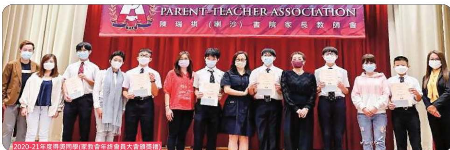
2020-21年度得獎同學(家教會年終會員大會頒獎禮)