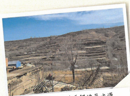
偏遠山區，缺乏耕地及水源 農耕及養殖技術落後