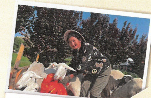
教導農戶飼養羊隻，增加收入