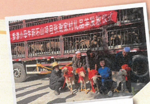
發放母牛/羊予項目農戶