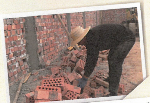
地震受災嚴重，過千房屋及牛、羊棚倒塌